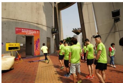
G/F 起步區 (所有賽事集合點)