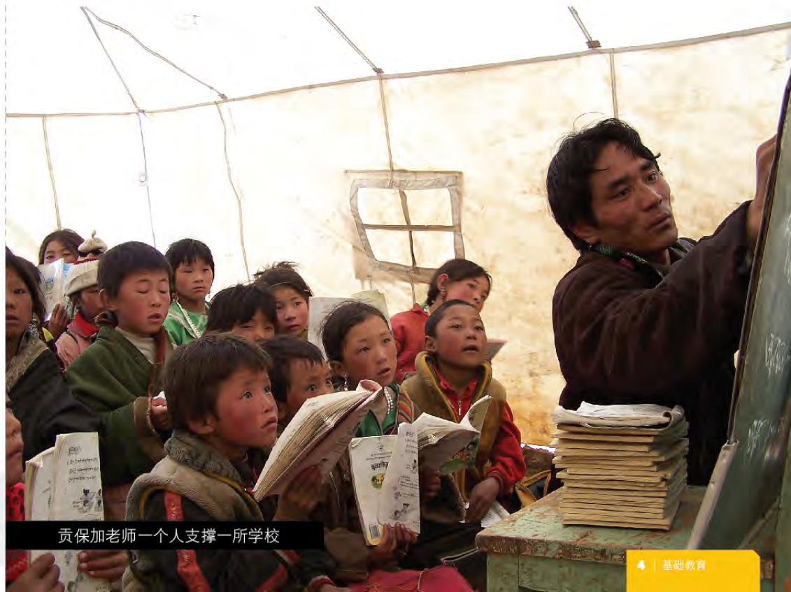
贡保加老师一个人支撑一所学校